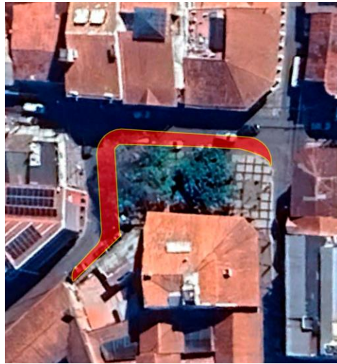
Imagen N° 2